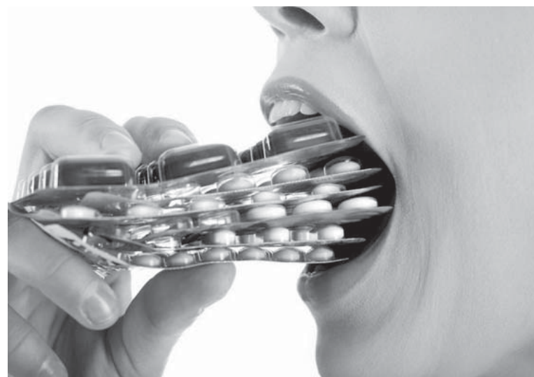
Полосу подготовила Елена ДУДИЧЕВА