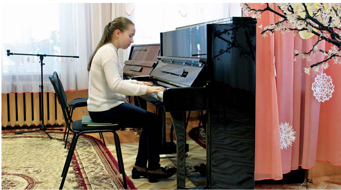
Перед новым годом многие школы искусств Нижегородской области получили новые музыкальные инструменты. Они были приобретены за счет федеральных средств по поручению Президента РФ. Варнавинская ДШИ получила пианино «Николай Рубинштейн» российского производства с немецкой механикой. Прекрасный новогодний подарок!